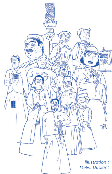
Illustration : Melvil Duplant

Expo visible à la Cité du mercredi au dimanche, de 13h à 18h, du 26 mai au 20 novembre 2022